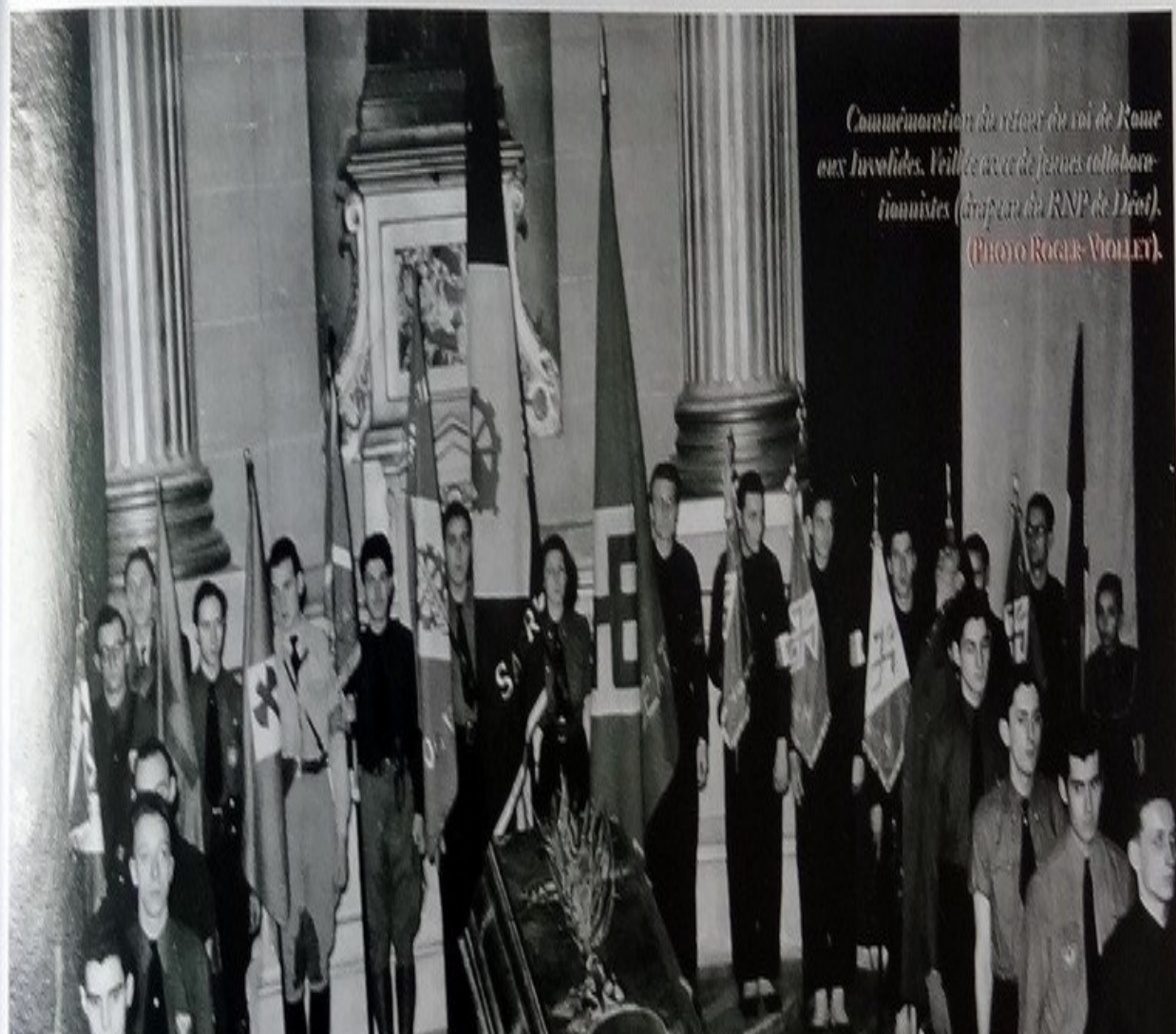
Commemoration du retour du roi de Rome aux Invalides. Veille avec de jeunes collaborationnistes (drapeau du RNP de Déat).

Chacun alla mener ses préparatifs et le directeur de cabinet du maréchal, du Moulin de La Barthète, entreprit de rédiger la lettre à Hitler. À ce moment, Laval entra chez lui et prit connaissance de la missive, dont il ne lut heureusement que le début.